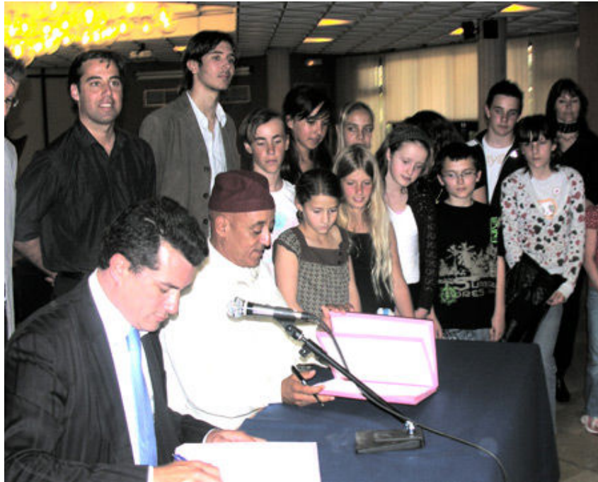
La ville de TATA au Maroc